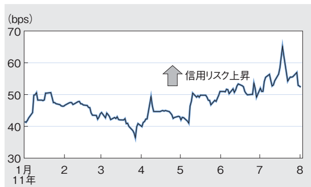
第2図 米5年物国債のCDS保証料率

ただし、債務上限は2段階で引き上げられ、まず今後10年間で歳出を9,170億ドル(約71兆円)削減し、上限額を9,000億ドル(約70兆円)引