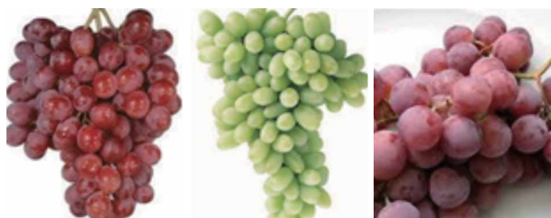
クリムゾン・シードレス