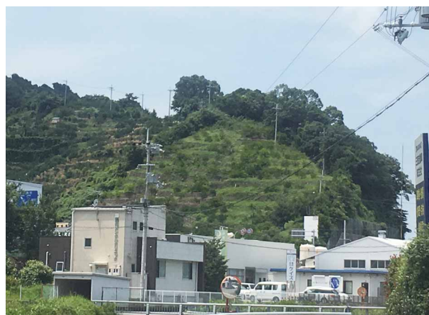
機械化の難しい傾斜地にあるミカン園

協議会での確認が終わると、書類を作成して農地中間管理機構に申請する必要がある。その際、JAは書類作成のサポートを行っている。書類の作成を面倒に思う農家も多いため、