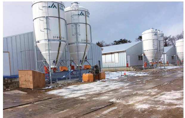
建設が進む第1肥育農場